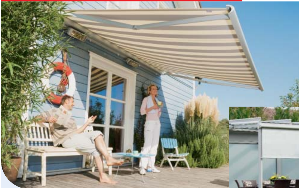
▲ weinor Markisen