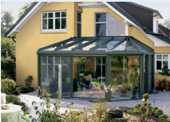
▲ weinor Wintergärten

Wie auch immer Sie Ihre Terrasse nutzen möchten, weinor hat das geeignete Produkt für Sie – Markisen, Terrassendächer und Wintergärten